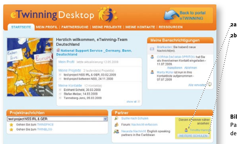
Bild 2: Partnervorschläge auf der Startseite des eTwinning-Desktops

Das System generiert auf der Basis Ihrer Profildaten (Alter der Schüler, Sprache, Fächer) automatisch eine Liste von Schulen, die ein ähnliches Profil aufweisen und damit für Sie als eTwinning-Partner in Frage kommen könnten. Sie finden die vorgeschlagenen Schulen mit den zugehörigen Profildaten auf der STARTSEITE des Desktops ( Bild 2 ), indem Sie im Feld PARTNER auf den NAMEN DER LEHRKRAFT (2a) bzw. auf WEITERE SCHULEN (2b) klicken.